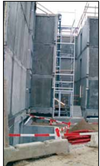
Så er der gjort klar med elevator i opgangen