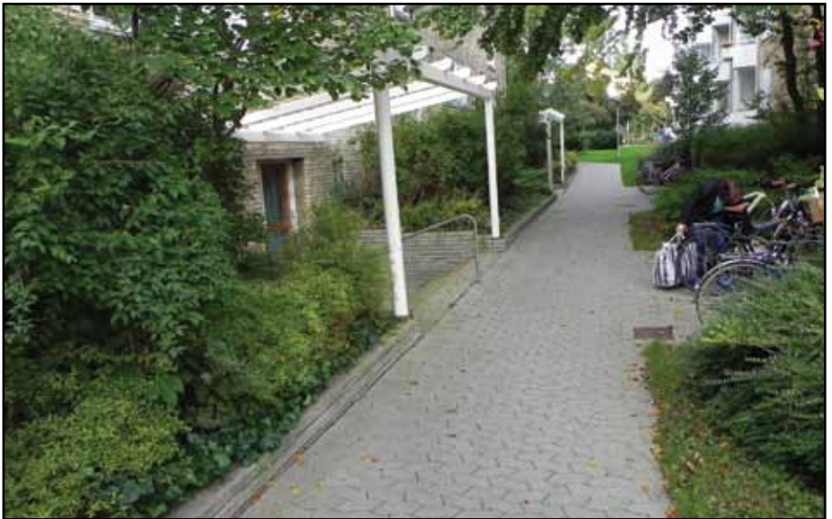
Indgangsparti ved Claus Petersens Allé