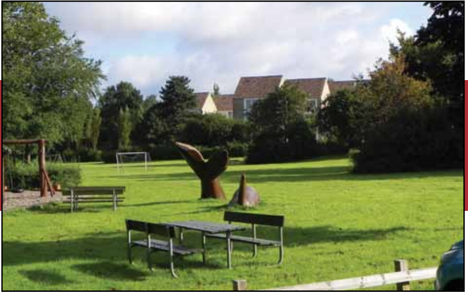
Spækhuggerne boltrer sig ved Gurrevej