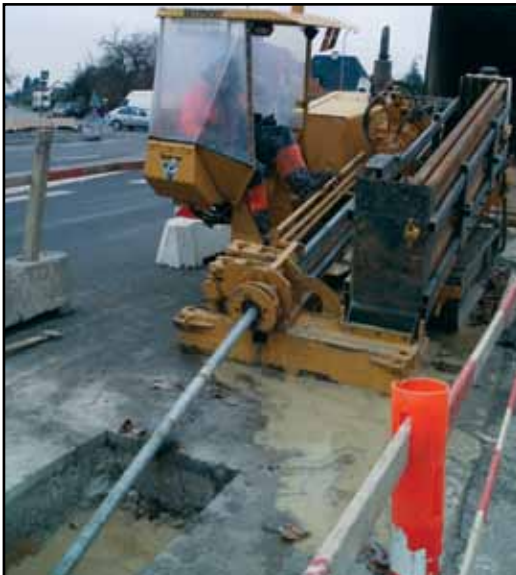
Fjernvarmen til boligerne er på vej under Hvidovrevej