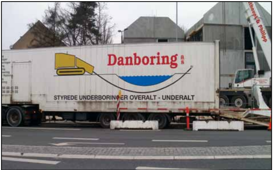
Forsyningsbilen klar til det store boringsarbejde